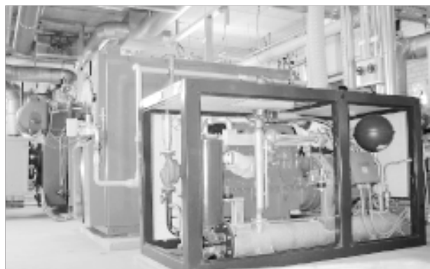
Abb. 4: Blockheizkraftwerk der Europaschule in Köln