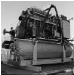
Solarstrommodule und Blockheizkraftwerk: Umweltfreundliche Kraftwerke für die Zukunft.

Insgesamt reduziert sich der Strombezug durch die beschriebenen Maßnahmen um über 70 % (von bislang 120.000 kWh auf etwa 30.000 kWh). Gleichzeitig werden hierdurch der Erdatmosphäre jährlich weit über 200.000 kg Kohlendioxid erspart - ein enormer Beitrag zum Klimaschutz.